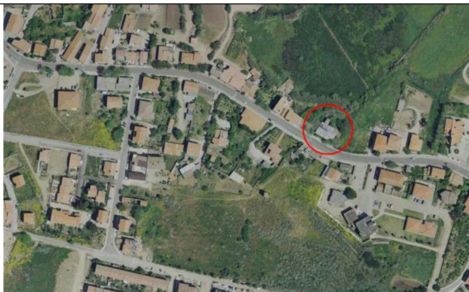
Foto inquadramento territoriale