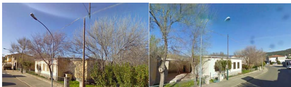
Foto Vista Fronte strada

Tutti gli impianti verranno rimessi in funzione e sostituiti laddove necessario.