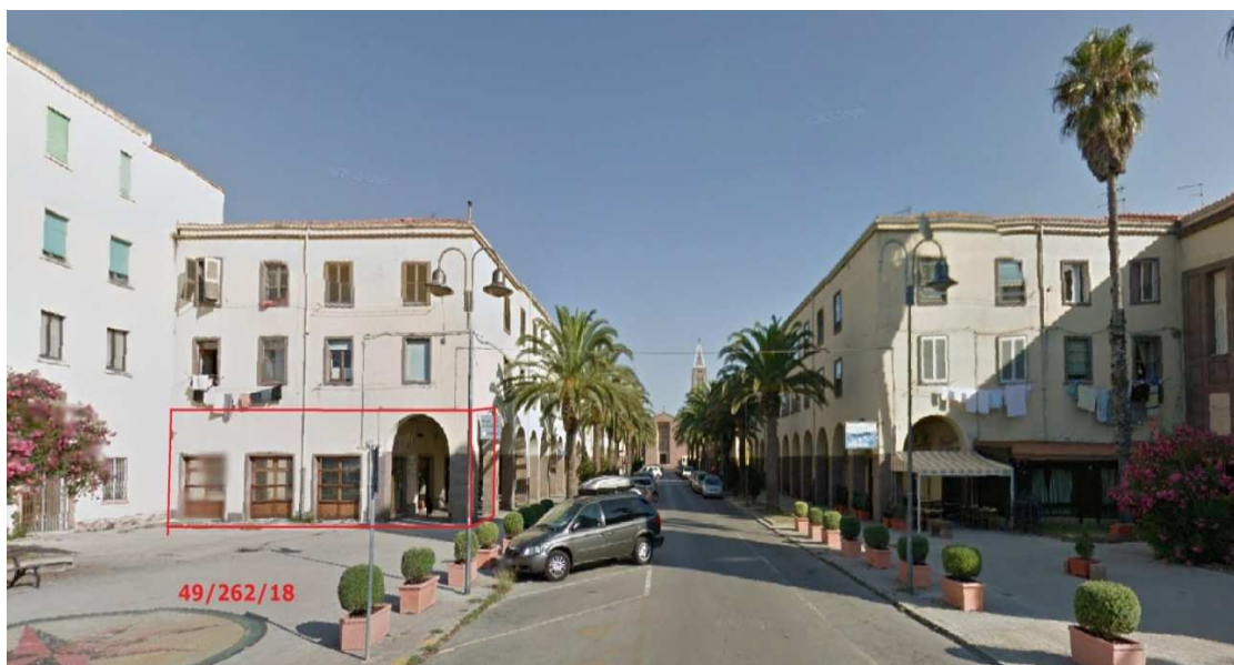
Veduta prospettica fabbricati su via Pola, fronte mare, con indicazione dell'unità immobiliare di cui al foglio 49, mappale 262, subalterno 18.

Direzione generale enti locali e finanze Servizio demanio e patrimonio e autonomie locali di Sassari