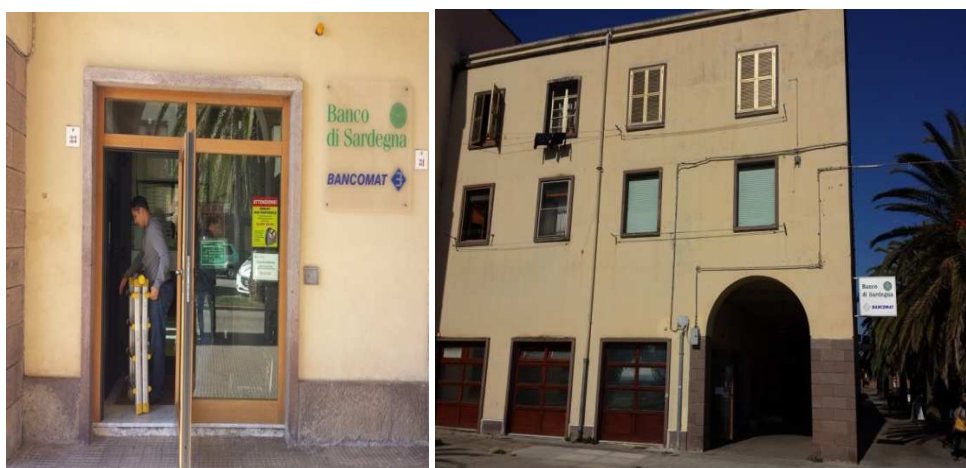
Veduta prospettica ingresso sulla via Pola e prospetto sulla piazza San Marco.