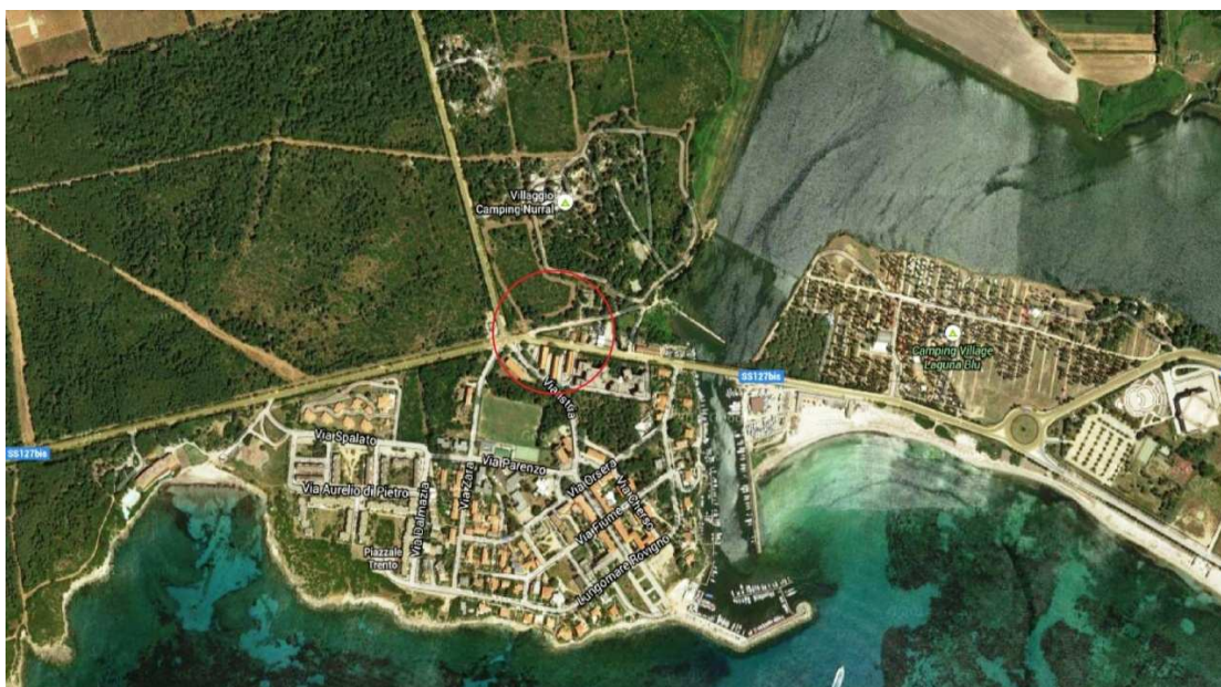
Aerofoto abitata di Fertilia e localizzazione di massima u.i.u.

Direzione generale enti locali e finanze Servizio demanio e patrimonio e autonomie locali di Sassari