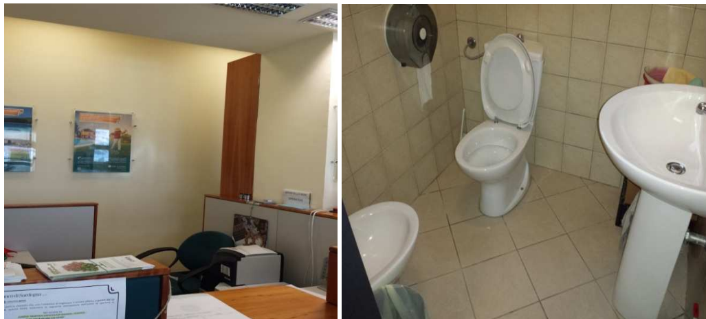
Dettaglio interni e particolare bagno del personale.

Direzione generale enti locali e finanze Servizio demanio e patrimonio e autonomie locali di Sassari