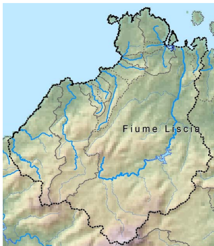
Figura 1-1 – Rappresentazione della U.I.O. del Liscia

Nel basso corso del Liscia, dove la salinità è ancora ridotta, cresce la tifa ( Typha angustifolia ), la felce palustre ( Osmunda regalis ), l'ontano nero e il salice di Gallura: la presenza di queste associazioni indicherebbe il vecchio tratto del fiume Liscia, che attraversava la bonifica di Barrabisa, quando la sua foce si apriva in prossimità dell'Isolotto di Porto Puddu.