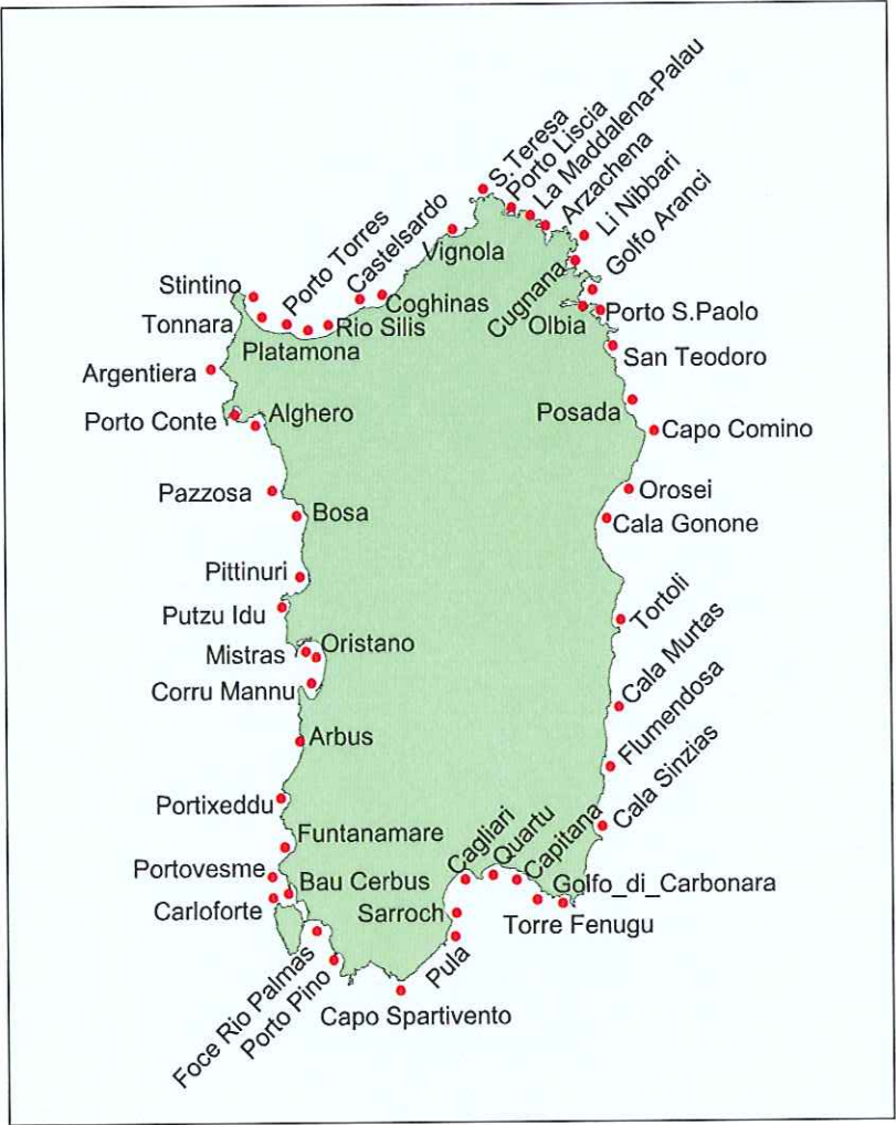
POSIZIONE DEI TRANSETTI

MINISTERO DELL'AMBIENTE - SERVIZIO DI DIFESA DEL MARE, 2000, "QUALITÀ DEGLI AMBIENTI MARINI COSTIERI ITALIANI 1996-1999", IN COLLABORAZIONE CON ICAM