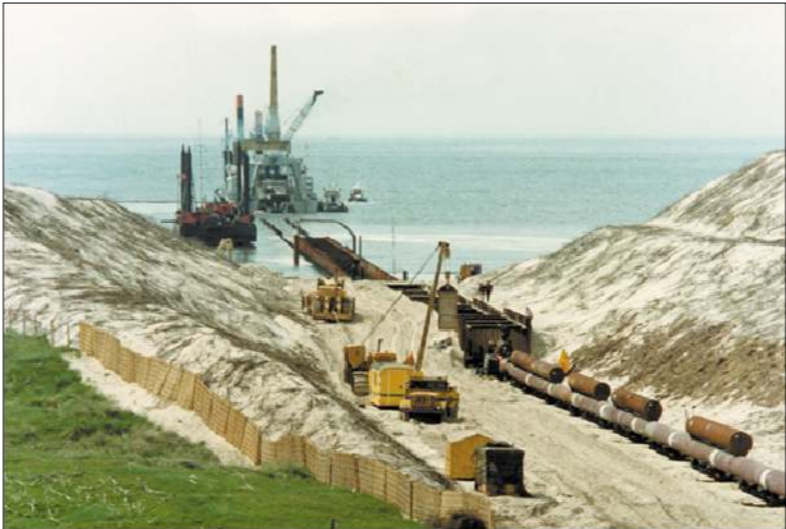
VISTA DA TERRA DELLA POSA A MARE (VISTA 1)