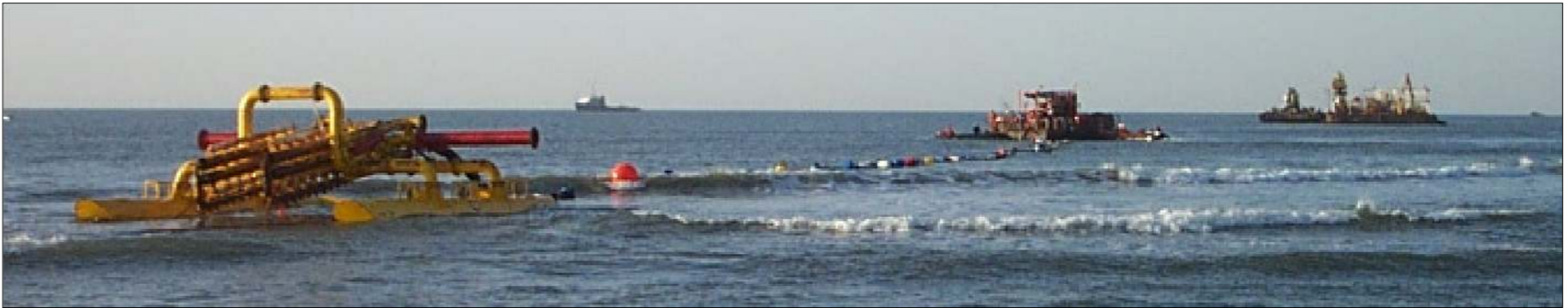
VISTA DA TERRA DELLA POSA A MARE (VISTA 3)

INTEC, 18 FEBBRAIO 2004, PRESENTAZIONE ALGERIA TO ITALY GAS PIPELINE