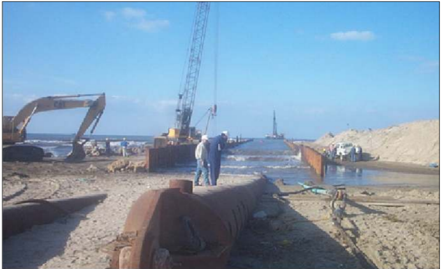
VISTA DA TERRA DELLA POSA A MARE (VISTA 2)