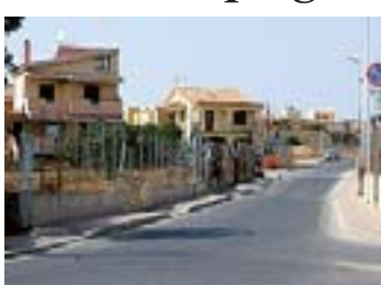
La strada teatro dell'attentato [N.B.]

CAGLIARI In fiamme l'auto di due impiegati