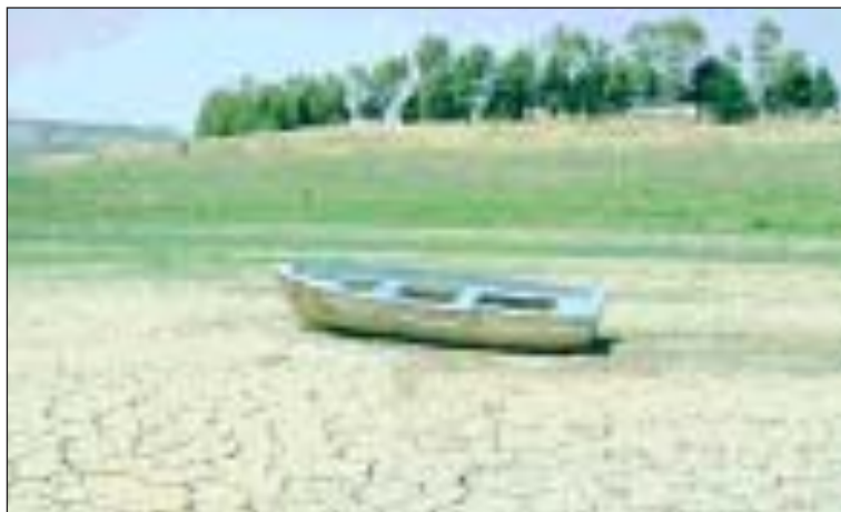
Una barca adagiata sul fondo del lago di Pianosa degli Albanesi

ROMA — La temperatura in Italia è aumentata molto più che altrove, addirittura quattro volte di più che nel resto del mondo, un chilometro su tre delle nostre coste basse arretrano e molte aree costiere rischiano di essere sommerse dal mare. Le temperature estive negli ultimi anni sono state quattro gradi sopra la media. «Occorre agire subito con interventi seri perché l'Italia e il Mediterraneo sono i primi a pagare gli effetti del cambiamento climatico», ha sostenuto il ministro dell'ambiente Alfonso Pecoraro Scanio alla conferenza nazionale sui cambiamenti climatici. I danni ammontano a 50 miliardi l'anno. Il presidente della Repubblica Giorgio Napolitano: «Sul clima l'Europa parli con una sola voce». Per Achim Steiner, responsabile ambiente dell'Onu, occorre investire nelle fonti alternative. «La lotta ai gas serra non è perduta ma occorre intervenire subito».