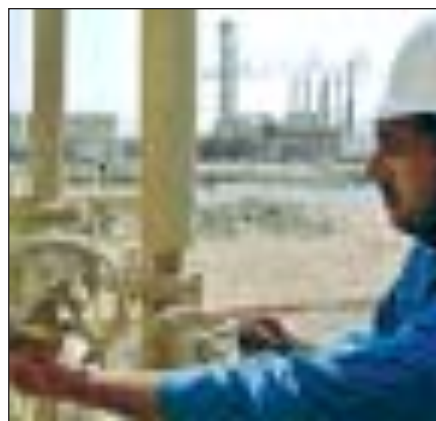
IEZZI, POLIDORI e PONS ALLE PAGINE 4 e 40

Indagati 21 studenti a Bari, incastrati dagli sms