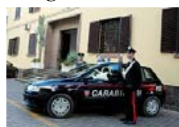
La caserma dei carabinieri a Carbonia

CARBONIA Rissa e coltellate, ragazzo ferito