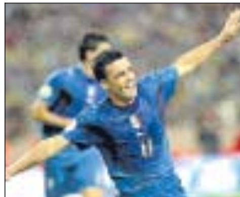
Antonio Di Natale autore dei due gol azzurri

Gli azzurri vincono 2-1 in Ucraina Super Di Natale lancia l'Italia verso gli Europei