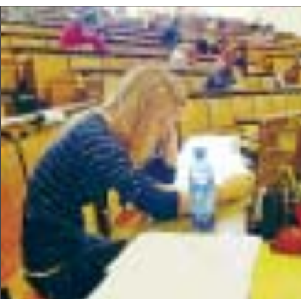
FOSCHINI e POLCHI ALLE PAGINE 14 e 15