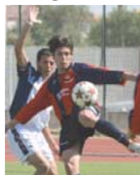
Un incontro di Promozione

Presentati a Cagliari i calendari dei campionati regionali di calcio. Coinvolti ventimila tra calciatori, dirigenti e tecnici.