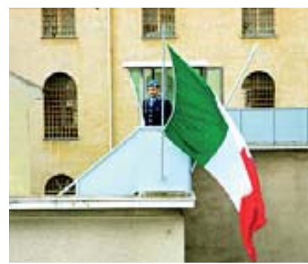
Il carcere di San Sebastiano

SPARATORIA SULLA 131 Due balordi di Orune inseguivano coppiette