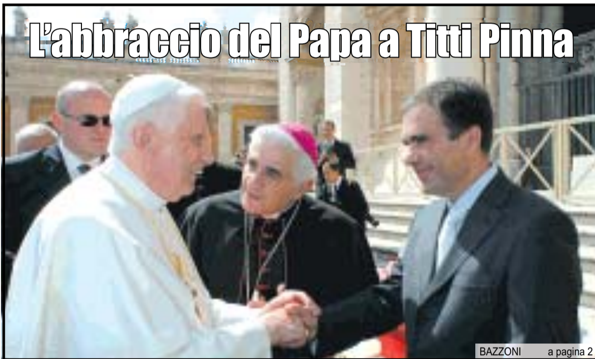
BAZZONI a pagina 2